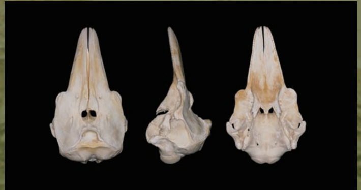
ネズミイルカ ( Phocoena phocoena ) の頭蓋骨 北半球の沿岸域や河口域に生息する小型のイルカ。イルカの頭骨の特徴である左右非対称性が見られる (左から、背側、左側、腹側)