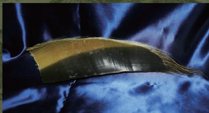
ヒゲクジラ ( Balaenoptera sp. ) のヒゲ板 歯のないクジラには、代わりにヒゲ板と呼ばれる歯ぐきが変化したものが100枚以上生えている。軽く適度な硬さと弾力性があり、靴ペラや耳かきなどの日用品に加工され、広く利用されていた