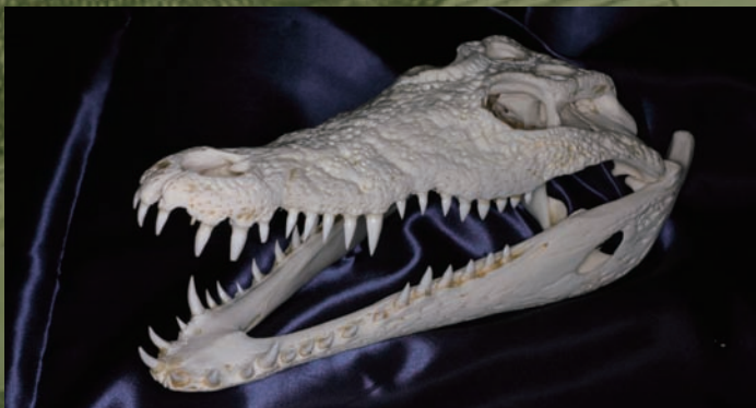
ナイルワニ ( Crocodylus niloticus ) の頭骨 アフリカに生息する、最大5mを超える大きさになるワニの仲間。魚やカエルなどを捕食する。大型のものは、哺乳類を捕食することがある