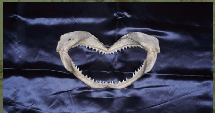
サメの顎、歯 サメの仲間は、表に出ている歯の後ろに、次の歯がすでに生えていて、ベルトコンベアーのように次々に前に出てくる仕組みになっている。歯が折れても、欠けても、定期的に補充される