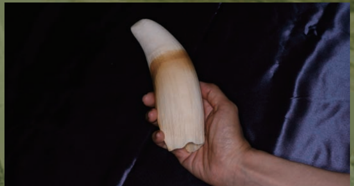
マッコウジラ ( Physeter macrocephalus ) の歯 歯を持つジラの中で、最大18mになるマッコウジラ。この歯は1本約400gあり、下顎に左右で50本前後生えている。総重量は約15kgにもなる