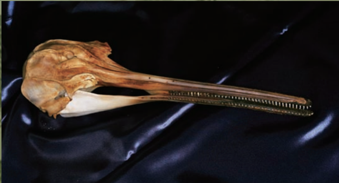
ラプラタカワイルカ ( Pontoporia blainvillei ) の頭骨 南米の大西洋沿岸にすむカワイルカの仲間。細長い口ばし、多数の同じ形の歯を持つのが特徴。イルカの仲間では珍しく、頭骨は左右対称

博物館に展示されている標本を、手に取って見たいと思ったことはありませんか？その夢を叶える小さな博物館が、川口市にオープン。実物の標本に触れて、肌触りを確かめ、持ち上げて重さを感じ、ひっくり返して裏側もチェック。生物のフシギな形をぜひ、ホンモノで体感してください。