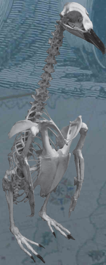
マゼランペンギン ( Spheniscus magellanicus )

博物館に展示されている標本を、触ってみたいと思ったことはありませんか?その思い、少しだけThink Squareで叶えてみてください。今回のテーマ、「水陸両用の生き物」たちが、肌触りや重さを感じ、裏側までも見てもらうことを、待っています。生物の不思議な形をぜひ、本物で体感してください。