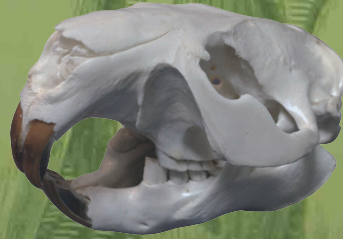
アメリカビーバー ( Castor canadensis )

胸元にある2本の黒いラインが特徴の南米に住むペンギン。時速7kmほどで水中泳ぐことができ、魚や甲殻類、イカなどを捕食する