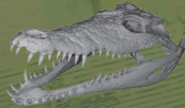
ナイルワニ ( Crocodylus niloticus )

アフリカの主に河川や湖に生息する、最大5mを超える大きさになるワニ。魚やカエルなどを捕食し、大型のものは哺乳類を襲うこともある。